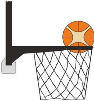
Kuvio 4 Pallo on korin sisässä

31-24 Toteamus. Jos puolustava pelaaja koskettaa palloa, joka on korin sisässä, kyseessä on korinhäirtärikkomus.