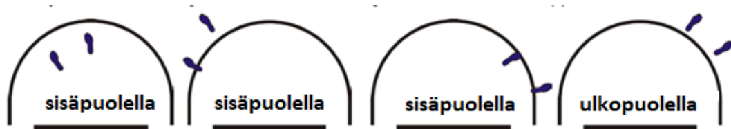
Kuvio 5 Pelaajan asema törmäyskaarialueen ulko-/sisäpuolella

33-4 Esimerkki: A1 yrittää hyppyheittoa, joka alkaa törmäyskaarialueen ulkopuolelta. Sen jälkeen hän törmää B1:een, joka on kosketuksessa törmäyskaarialueeseen.