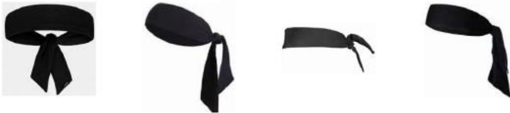
Kuvio 1 Esimerkkejä huivimaisista otsanauhoista

4-4 Toteamus. Huivimaista otsanauhaa ei saa käyttää.