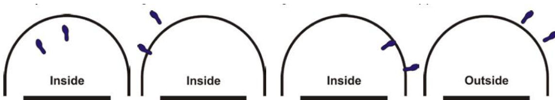
Kuvio 4 Pelaajan asema törmäyskaarialueen ulko-/sisäpuolella

Tulkinta: Laillinen suoritus. Tilanteeseen sovelletaan törmäyskaarialueen sääntöä.