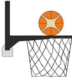
Kuvio 2 Pallo on kosketuksessa renkaaseen.

31-15 Toteamus. Kyseessä on korin häirintä pelitilanneheitossa, jos hyökkääjä tai puolustaja koskettaa koria tai levyä silloin, kun pallo on kosketuksessa renkaaseen, ja sillä on edelleen mahdollisuus mennä koriin.