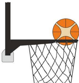
Kuvio 3 Pallo on korin sisässä

31-20 Toteamus. Jos puolustava pelaaja koskettaa palloa, joka on korin sisässä, kyseessä on rikkomus.